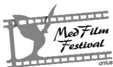
Med Film Festival onlus