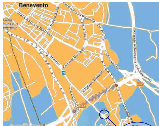
VILLA DEI PAPI

A tal fine, la SPO-Campania promuove la realizzazione di corsi di formazione, seminari, convegni ad elevato contenuto tecnico-scientifico grazie al coinvolgimento di docenti e professionisti con esperienza specifica nel settore.